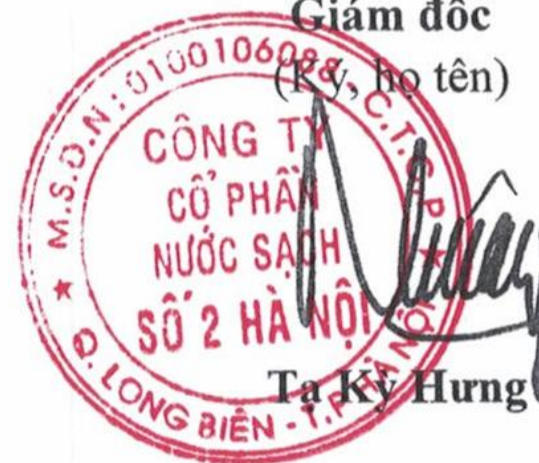
Ta Kỳ Hưng